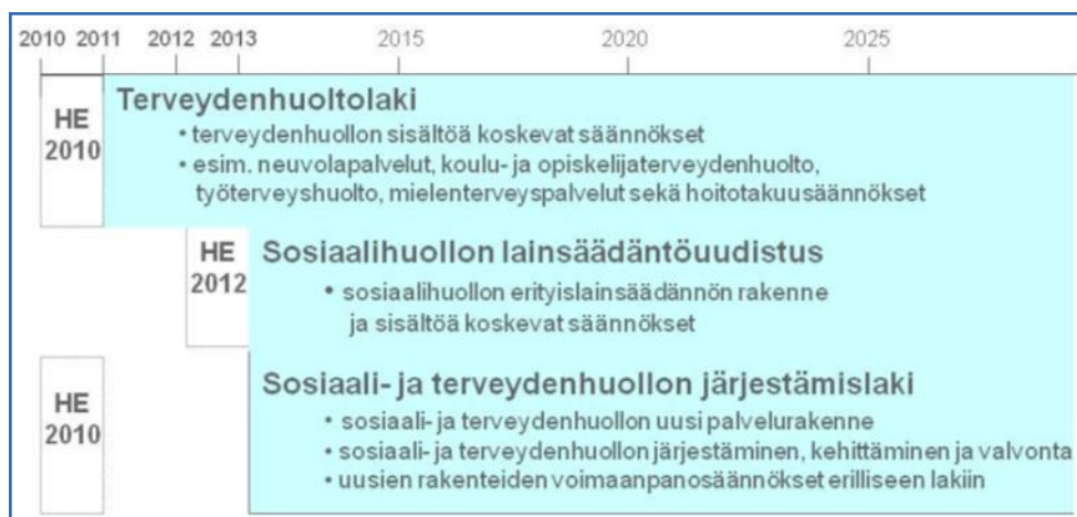
Lainsäädännön uudistamisen aikataulu