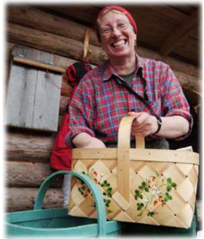
Hiking Travel, Ylöjärvellä toimiva luontomatkailun yritys