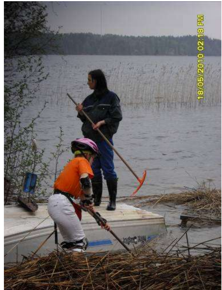
Työtä ja toimintaa Hakamaan maatilalla (Eteva - kuntayhtymä)