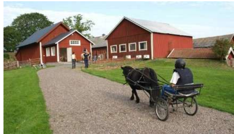
Päivätoimintaa Högbyn tilalla Ruotsissa