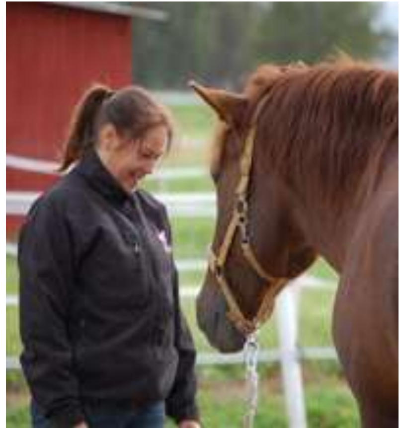
Sosiaalipedagogista hevostoimintaa Toiskan tallilla