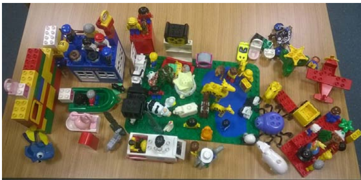
Kuvassa näkemys hankkeen, Iso apu- palvelukeskuksen ja kehitysvammaisten paikallisyhdistyksen tulevasta Kaveritoiminnasta.

Järjestöille tarkoitettuja tuotteistustyöpajoja järjestettiin yhdessä Saimian henkilöstön kanssa Kouvolassa 18.11. ja 7.12. sekä Lappeenrannassa 25.11. ja 14.12. Työpajoissa käytiin läpi mahdollisuuksia ja työkaluja omien tuotteiden hahmottamiseen ja työstämiseen. Ensimmäisen työpajan teoriaosuuden päätteeksi kokeiltiin konkreettista ideointi ja ideoiden arvostus –työkalua (Idea Wall) , jota järjestöt hyödynsivät työpajojen välissä. Samalla he oppivat työkalun käytön ja voivat hyödyntää sitä jatkossa omassa toiminnassaan.