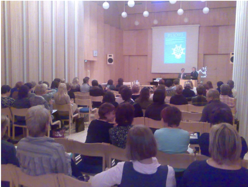
Puolimatkan seminaari keräsi salin täyteen ihmisiä keskustelemaan ja kuulemaan varhaiskasvatuksesta.

Ruori kokosi alueen varhaiskasvattajia kahteen foorumiin vuonna 2007. Toinen foorumeista käsitteli hiljaisen tiedon ideologiaa ja toinen pureutui työhyvinvoinnin kysymyksiin. Lisäksi Ruori koulutti tiimien johtajia ja -jäseniä sekä osallistui alueen koulutusorganisaatioiden varhaiskasvattajille suunnattujen koulutusten suunnitteluun. Myös muuta verkostotyötä jatkettiin mm. muiden varhaiskasvatuksen kehittämissuhteiden kanssa. Ruorin väliraportti "Matkalla Kaakkois-Suomessa - varhaiskasvatuksen kehittämissuhteet Ruorin alkutaival" julkaistiin marraskuun lopussa (saatavilla osoitteesta www.socom.fi → kehittämisaalueet → varhaiskasvatuksen kehittämissuhteet → Tietopankki → Raportteja ). Kaakkois-Suomen varhaiskasvatuksen kehittämissuhteet Ruorin vuosi huipentui hankkeen Puolimatkan seminaariin 28.11., jossa esiteltiin laajasti tehtyä kehittämissuhteita, julkaistiin väliraportti sekä Ruori-juliste.