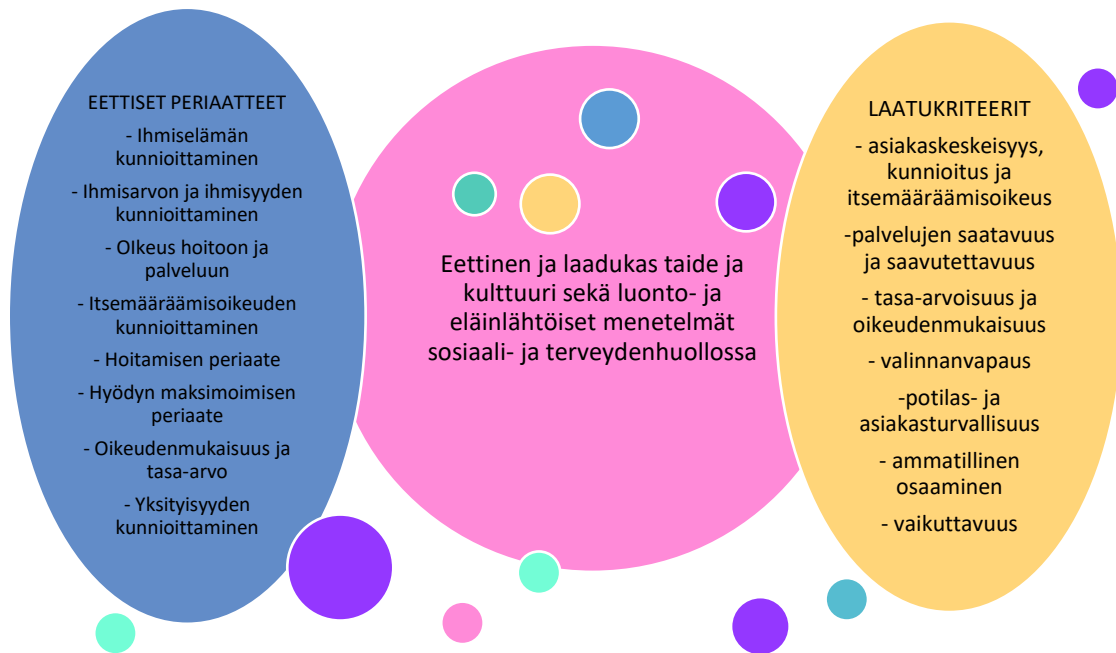
Kuvio 3. Eettinen ja laadukas taide ja kulttuuri sekä luonto- ja eläinlähöiset menetelmät sosiaali- ja terveydenhuollossa

Tämä on ensimmäinen työpaperi taiteen eettisten periaatteiden ja laatuksiteerien tarkasteluun sosiaali- ja terveyspalvelujen tarjoajien näkökulmasta. Se tarjoaa pohjan sosiaali- ja terveyspalvelujen eettisten periaatteiden ja laatuksiteerien soveltamiseen taiteeseen sekä luonto- ja eläinlähöisiin menetelmiin. Kehittämistyön tueksi tarvitaan laadukkaita tieteellisiä kirjallisuuskatsauksia aihepiiriin liittyen. Lisäksi tarvitaan poikkitieteellistä tutkimusta eri näkökulmista.