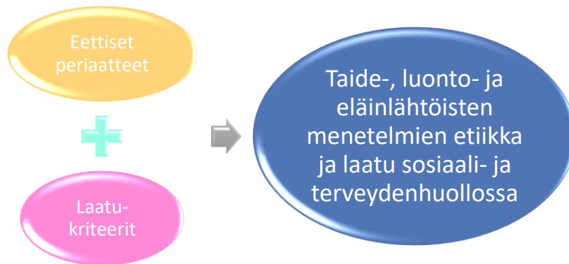
Kuvio 1. Taide-, luonto- ja eläinlähöisten menetelmien etiikka ja laatu sosiaali- ja terveydenhuollossa

Ymmärrys palvelun laadusta ja toiminnan eettisyydestä ei synny itsestään. Työntekijät, joilla on koulutus sekä taiteen että sosiaali- tai terveydenhuollon alalta, ovat joutuneet pohtimaan palvelun laatua ja toiminnan eettisyyttä. Näitä asioita opetetaan myös useissa täydennyskoulutuksissa. Taiteen ammattilaiset, joilla ei ole koulutusta tai muuta perehtyneisyyttä sosiaali- ja terveydenhuollon laatuksiteereihin tai eettisiin periaatteisiin, eivät omaa tarvittavaa tietoperustaa. He ovat voineet kuitenkin omaksua tarvittavan osaamisen käytännön työssä.